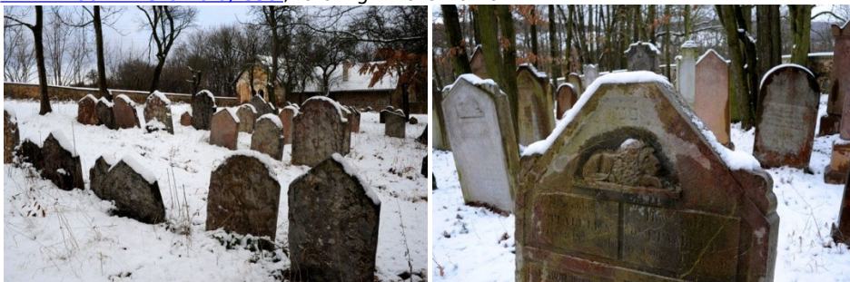
hřbitov v Litni