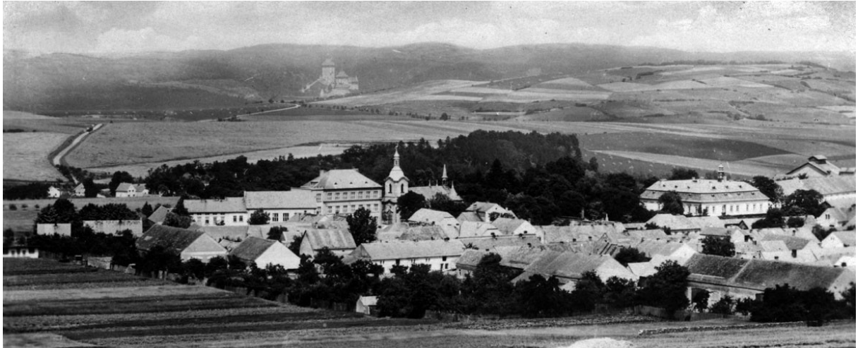
fotografie Litně okolo roku 1900